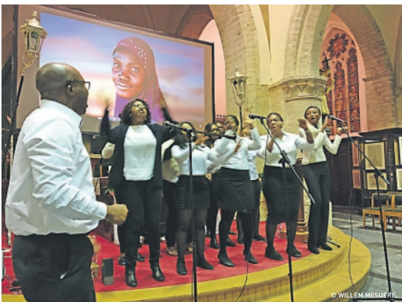
Het Congolese koor Chorale luisterde de officiële opening op.

INFORMATIE – Luc Van Duyse, via lucvanduyse@skynet.be