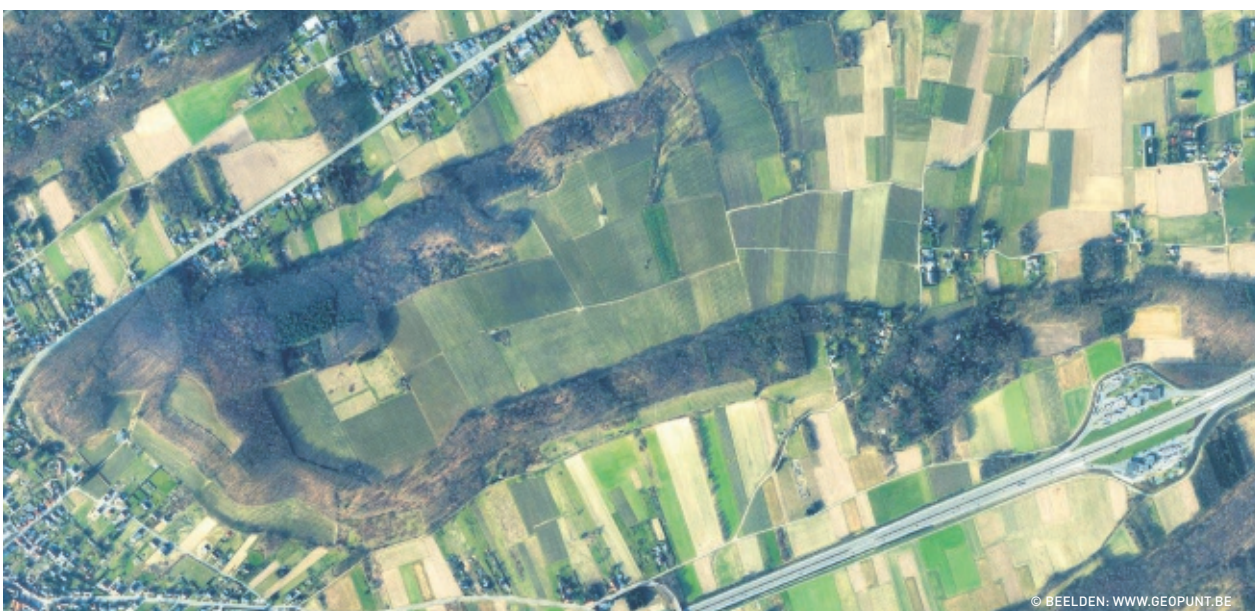
De laagstamfruitbomen staan allemaal in natuurgebied.