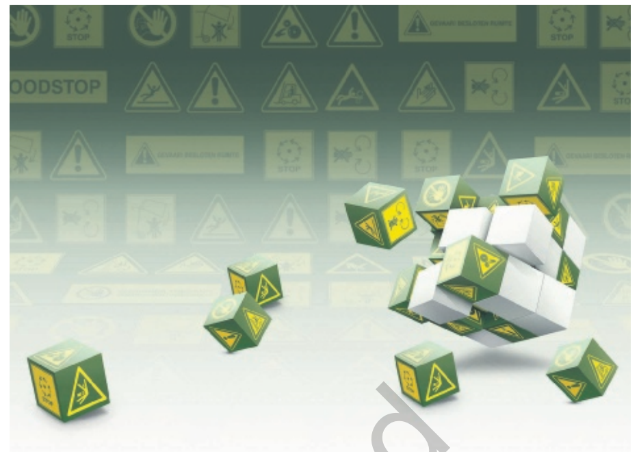
Het beheersysteem, ontwikkeld in het ADLO-project 'Arbeidsveiligheid in de tuinbouw', is een goede leidraad voor een basisvorming rond de organisatie en werking 'welzijn op het werk'.

De driedaagse opleiding 'Arbeidsveiligheid in de tuinbouw' (12 uur) vindt plaats op donderdag 25 januari, dinsdag 30 januari en donderdag 8 februari, telkens van 13.30 tot 17.30 uur in het Proefstation voor de Groenteteelt, Duffelsesteenweg 101 in Sint-Katelijne-Waver.